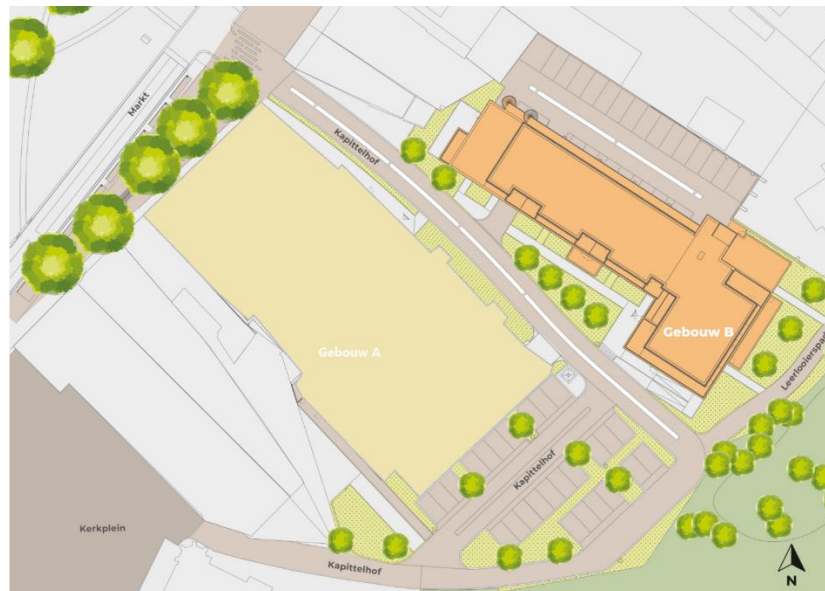
Ligging gebouwen project Hart van Rooi. Gebouw B omvat de appartementen voor bewoners Stichting Eigen Sleutel.

Stichting Eigen Sleutel huurt van Woonmeij een gezamenlijke ruimte waar onze toekomstige bewoners elkaar kunnen ontmoeten en indien gewenst met elkaar kunnen gaan eten. De gezamenlijke ruimte van ongeveer 90 m2 heeft een berging, een invalidentoilet, een kantoorruimte voor de zorgaanbieder, een grote woonkamer en keuken in een en een balkon. Vanuit woningcorporatie Woonmeij worden appartementen gebouwd door Gebroeders Van Stiphout. Oplevering is 4e kwartaal 2024.