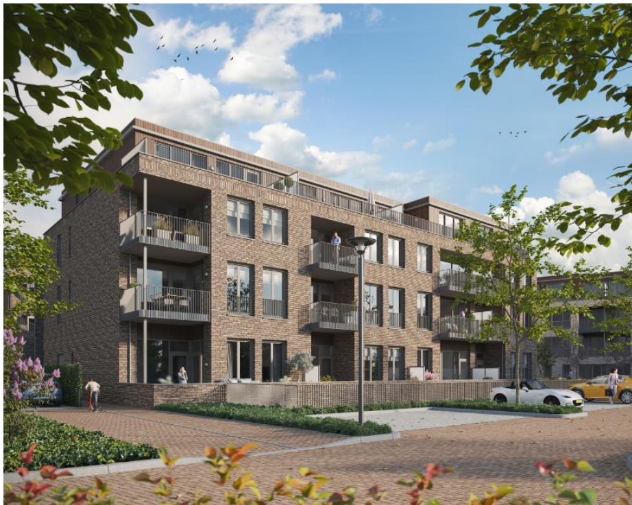
3D tekening van het complex Kapittelhof te Sint-Oedenrode

Nu de bouw steeds concretere vormen aan begint te nemen en we een definitieve richtlijn hebben voor de datum van oplevering kunnen we ook steeds meer zichtbaar maken wat we kunnen bieden.