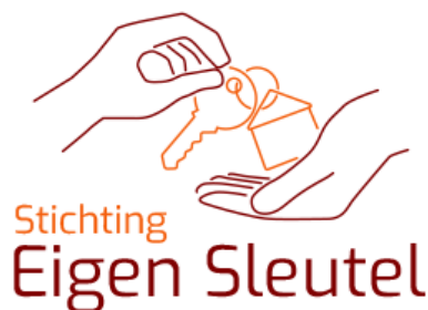
Het logo van de stichting

Onze bewoners hebben elk hun eigen talenten en mogelijkheden. Het stimuleren van deze capaciteiten en het leren omgaan met hun beperkingen vergt inzet van alle betrokkenen. Samen met de bewoners en begeleiders streven we naar een balans tussen ondersteuning, eigen mogelijkheden en verantwoordelijkheden. Waar nodig wordt specialistische hulp ingeschakeld via zorgaanbieders of externe instanties, zoals psychiaters of gedragsdeskundigen.