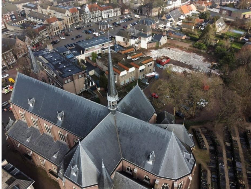
Luchtfoto Kapittelhof, met op de voorgrond de Martinuskerk. Rechtsboven de bouwplaats "Hart van Rooi" na de sloop van de vorige bebouwing.

Op 1 februari was het eindelijk zo ver: de officiële start van de sloop. Door de wethouder werd met een grote kraan een muur van de inmiddels oude lege panden gesloopt. Alle ouders en bewoners waren hiervoor uitgenodigd en degene die het niet bij kon wonen werd door ons met mooie foto's op de hoogte gebracht van de start van de sloop. Nadien was er een gezellig samenkomen. Wat een fantastisch moment waar vele van ons naar uitgekeken hebben.